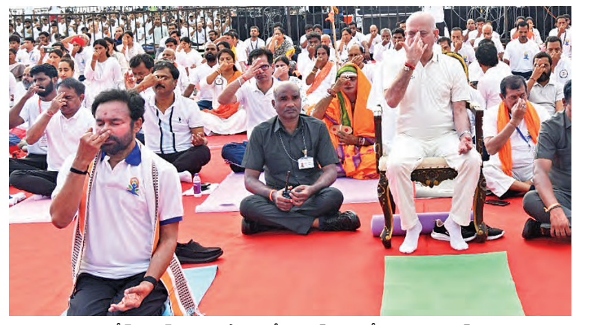
శనివారం పెరేడ్ గ్రాండ్స్ యోగా సాధనలో గవర్నర్ శుక్లా, కేంద్రమంత్రి కిషన్ తదితరులు