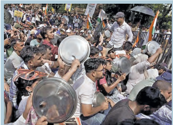
శనివారం ఢిల్లీలోని జంతర్ మంతర్ వద్ద కేంద్ర మంత్రి ధర్మేంద్ర రాజ్ నామా చేయాలని ఆందోళన చేస్తున్న కాకోవీ పార్టీ నాయకులు