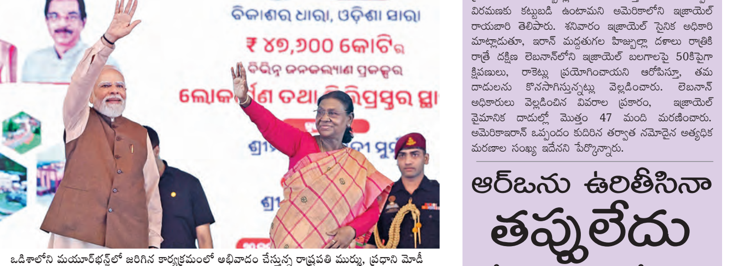
ఓడిశాలోని మయూర్భంజ్ లో జరిగిన కార్యక్రమంలో అభిషేకం చేస్తున్న రాష్ట్రపతి ముర్ము, ప్రధాని మోడీ