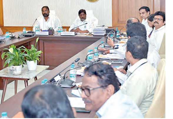
ఆయన సూచించారు. రైతులకు వ్యవసాయం పైనే కాకుండా, పాడి పరిశ్రమ ద్వారా అదనపు జీవనోపాధి కల్పించేందుకు అవసరమైన అన్ని రకాల చర్యలు తీసుకోవాలన్నారు.

బదిలీ చేయాలని చెప్పారు. దీనివల్ల రైతులకు అలాంటి బకాయిలు ఉండవని చెప్పారు. గ్రామీణ ప్రాంతాల్లోని ప్రజలు పాడి పరిశ్రమ మీద ఆధారపడి తారని, ఈ నేపథ్యం లో వారికి సమయా నిక బట్టులు చెల్లిస్తే సంబంధిత కుటుం బాలు అభివృద్ధి అవ్వాలని బలోపేతం అవుతా యన్నారు. తెలంగాణ రాష్ట్రంలో పాడి పరిశ్రమను లాభ సాధిగా గణనీయంగా అనుసరించాలని ఆయన పేర్కొన్నారు.