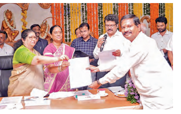
స్టేట్ ఇన్స్టిట్యూట్ ఆఫ్ టెక్నాలజీ అడ్వైస్ డిప్యూటీ సీఎం భట్టి విక్రమార్క తెలిపారు.

హైదరాబాద్, జూన్ 20, ప్రభాకర్ ప్రధాన: అక్రమాస్తుల కోసం అరెస్టు చేసిన మల్టీ బోస్-2 సర్వీ లాండ్ రికార్డు డిప్యూటీ డైరెక్టర్ నుంచి నరహరి అక్రమాస్తులు మరల్చింది అని అధికారులు వెలికి తీశారు. ఈ నెల 16వ తేదీన నరహరిని అరెస్ట్ చేసిన అధికారులు అరెస్టు చేయడం తెలిసింది . ఈ సందర్భంగా ఆయన వద్ద 13 కోట్ల రూపాయలకు పైగా నగదు, నగలు పట్టుబడడం విడిచిపెట్టారు. బహారంగ మార్కెట్లో వీటి విలువ 150 కోట్ల రూపాయల వరకు ఉంటుందని అధికారులు వెలుతున్నారు. ఈ కోసులో మరల్చి అక్రమాస్తులను గుర్తించేందుకు నరహరి బ్యాంకు లాక్డౌన్ తెలిపేందుకు అధికారులు అలాంటి అక్రమాస్తులను నరహరితో పాటు ఆయన కుటుంబ సభ్యులను కోర్టు వారు అరెస్టు అంకితం చేశారు. దీంతో అరెస్ట్ కోర్టు అనుమతితో శనివారం నాడు పాతబస్లోని శాలిబందలో గల కెనరా బ్యాంకు కులో గలనరహరికి చెందిన రెండు లా కర్తను బద్దలు కొట్టగా అందులో ఒక దాంట్లో కోటిన్నర రూపాయల నగదు, ఇతరదాంట్లో 12 బంగారు బిస్కెట్లు (ఒక్కో బిస్కెట్ వంద గ్రాము లు వుంది), వజ్రాలు పొడిగిన బంగారు నెక్లెస్ వెలుగులోకి వచ్చాయి. వీటి విలువ రెండు కోట్లగా నిర్ధారించారు. వీటిని జప్తు చేసిన నరహరి అధికారులు నరహరి అక్రమాస్తుల చిహ్నాలను మరోసారి విడుదల చేసారు. తాజాగా అతని ఆస్తుల విలువ 16 కోట్ల 50 లక్షల రూపాయలుగా తెలిసింది.