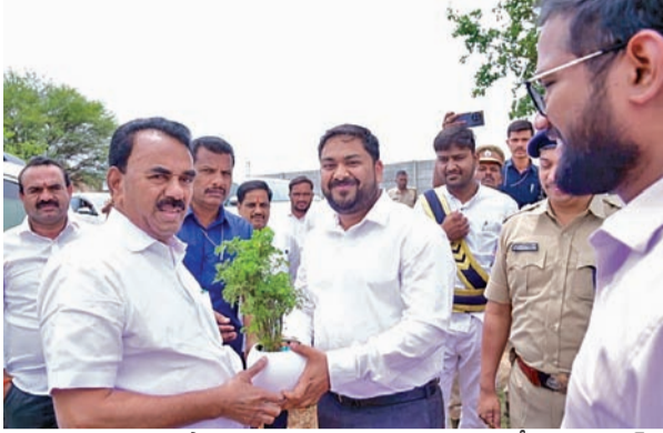
మంత్రి జూపల్లి కృష్ణారావుకు పూల మొక్క కుండి అందజేస్తున్న కలెక్టర్

నాగర్ కర్నూల్ ప్రతినిధి, జూన్ 20. ప్రభాతవార్త: నాగర్ కర్నూల్ జిల్లాలో పర్యావరణ పరిరక్షణకు ప్రతి ఒక్కరూ బాధ్యతాయుతంగా వ్యవహరించాలని రాష్ట్ర ఎక్సైజ్, పర్యాటక, సాంస్కృతిక శాఖల మంత్రి జూపల్లి కృష్ణారావు పిలుపునిచ్చారు. నాగర్ కర్నూల్ పట్టణంలోని ఇందిరా మహాళ శక్తి భవన సమీపంలో గల ప్రభుత్వ స్థలంలో మన మహాత్మ్య కార్యక్రమంలో భాగంగా శనివారం జిల్లా అటవీశాఖ ఆధ్వర్యంలో ఏర్పాటు చేసిన