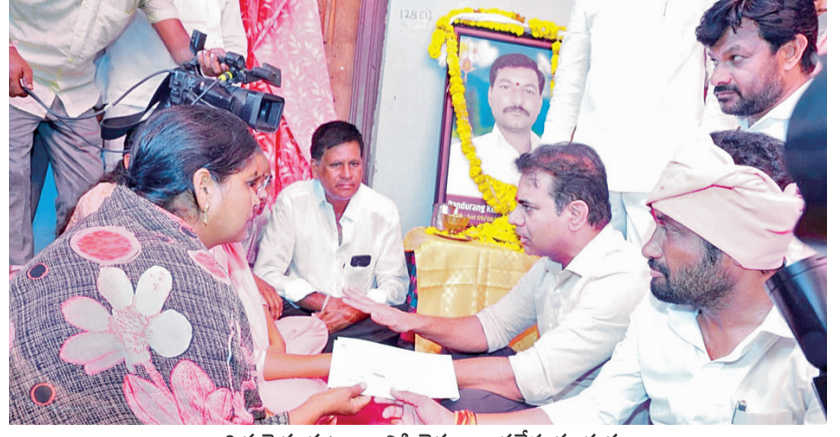
బాధిత రైతు కుటుంబానికి చెక్కు అందజేస్తున్న ద్భుత్వం

అదిలాబాద్ ప్రతినిధి, జూన్ 20. ప్రభాతవార్త : అదిలాబాద్ జిల్లాలోని బోధ్ నియోజకవర్గ టీఆర్ఎస్ కార్యకర్తలు శనివారం ఏర్పాటు చేసిన సమావేశంలో రైతు బంధు ప్రభుత్వ పోయి రాబందు ప్రభుత్వ వచ్చిందని, కరోనా కంటే దేదెడల్ కాంగ్రెస్ ప్రభుత్వమని, రైతులు కాళ్ళ కాళ్ళ కాంగ్రెస్ నాయకుల కాలర్ పట్టుకోవాలని టీఆర్ఎస్ వర్గం ప్రెసిడెంట్, సీనియర్ ఎమ్మెల్యే కెటిఆర్ అన్నారు. ఈ సందర్భంగా ఆయన మాట్లాడుతూ మొన్నటి వరకు చివరి గింజ వరకు రాష్ట్ర ప్రభుత్వం ధాన్యాన్ని కొనుగోలు చేస్తుందని, రైతులు ఎవరు అధైర్య పడకండి అని బహిరంగ సభలలో తెలిపి జైవల జరిగిన క్యాబినెట్ సమావేశంలో కేంద్ర ఇచ్చిన కోటా కంటే అధికంగా కొనుగోలు చేయకూడదని క్యాబినెట్ తీర్మాణం చేసినట్లు ఆయన అన్నారు. కేసీఆర్ ప్రభుత్వం రైతులను రాజు చేసినట్లు ప్రపంచంలో ఎక్కడ లేని విధంగా రైతులందరి పథకం పెట్టి అర్థికంగా అదుకున్నట్లు, రెండంసార్లు రుణమాఫీ చేయడం జరిగిందని వెల్లడించారు. మిషన్ కాకతీయ పథకంలో భాగంగా చెరువు పూడికతీత పనులు చేపట్టి చెరువులకు పూర్వ వైభవం చెప్పినట్లున్న ఆయన అన్నారు. గతంలో 1కోటి30 లక్షల ఎకరాల ఉన్న సాగు చేసిన ప్రభుత్వ హయాంలో 2 కోట్ల 30 లక్షలకు చేరుకుందని, అదనంగా ఒక కోటి ఎకరాల సాగు అధికంగా అయినట్లు తెలిపారు. ఎన్నికల ప్రచారంలో భాగంగా రైతు డిక్లెరేషన్ పేరుతో అవగాహన రైతులను మోసం చేశారని అన్నారు. అన్ని పంటలకు బోసెన్ 500 రూపాయలు ఇస్తామని, 40 రకాల సన్నలు అని