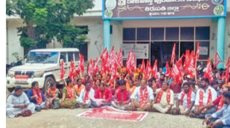
పెండింగ్లో ఉన్న వేతనాలు వెంటనే చెల్లించాలని, కాంట్రాక్ట్, అవుట్ సోల్సింగ్ కార్మికులను రెగ్యులరైజ్