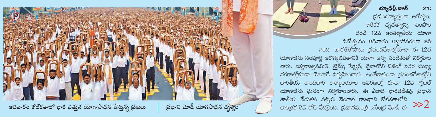
ఆదివారం కోల్కతాలో భారీ ఎత్తున యోగాసాధన చేస్తున్న ప్రజలు | ప్రధాని మోడీ యోగాసాధన దృశ్యం

న్యూఢిల్లీ, జూన్ 21: ప్రపంచవ్యాప్తంగా ఆరోగ్యం, శారీరక దృఢత్వాన్ని పెంపొందించే 12వ అంతర్జాతీయ యోగా దినోత్సవం ఆదివారం ఆట్లహోసరంగా జరిగింది. భారత్ తోపాటు ప్రపంచదేశాల్లోకూడా ఈ 12వ యోగాదేను సంవృద్ధ ఆలోచనానికై యోగా అన్న సందేశంతో నిర్వహించారు. ఐక్యరాజ్యసమితి, టైమ్స్ స్క్వేర్, చైనాలోని టీజింగ్ ఇతర ముఖ్య నగరాల్లోకూడా యోగాదే నిర్వహించారు. అంతేకాకుండా ప్రపంచదేశాల్లోని భారతీయ రాయభార కార్యాలయాల ఆవరణల్లో కూడా 12వ గ్లోబల్ యోగాదేను ఘనంగా నిర్వహించారు. ఈ ఏడాది భారతదేశపు ప్రధాన శాఖీయ వేడుకల క్రమంగా యోగా సాధన కోల్కతాలోని చారిత్రక రెడ్ రోడ్ వేదికైంది. ప్రధానమంత్రి నరేంద్ర మోడీ ఈ >>2