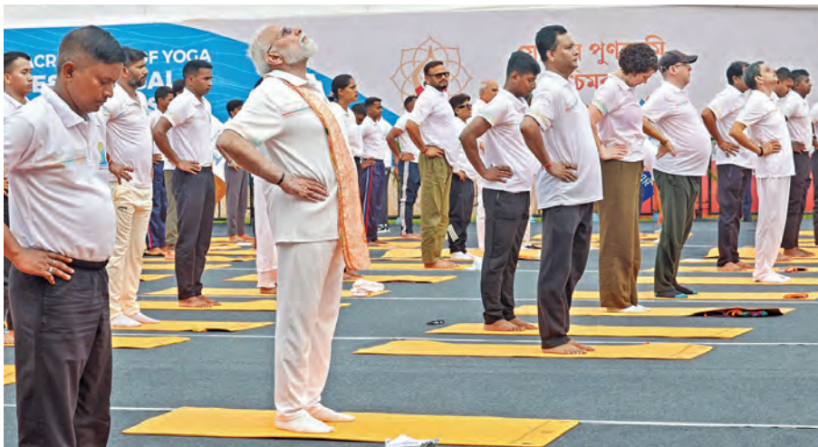
ఆదివారం కోల్కతాలో జరిగిన యోగా దినోత్సవంలో పాల్గొన్న ప్రధాని మోడీ - '2'లో

కోల్కతా, జూన్ 21: భారత రక్షణ రంగంలో చరిత్రాత్మక ఘట్టం అవిచ్ఛిన్నమైంది. గతంలో ఎన్నడూ లేని విధంగా ఆత్మనిర్భర భారతీ సంకల్పంతో పూర్తి స్వదేశీ సాంకేతికతతో తయారైన మూడు అత్యధునిక యుద్ధనౌకలు ఒకేసారి భారత నౌకాదళంలోకి అడుగుపెట్టాయి. దేశీయ రక్షణ సామర్థ్యానికి నిలువెత్తు నిదర్శనంగా నిలిచిన ఐఎస్ఎస్ దూసగిరి, ఐఎస్ఎస్ సంకేధక్, ఐఎస్ఎస్ అగ్రయే యుద్ధనౌకలను ప్రపంచ ప్రఖ్యాతి దినోత్సవ సందర్భంగా కోల్కతాలోని శ్యాంప్రకాష్ ముఖర్జీ పోర్టులో ప్రధానమంత్రి నరేంద్రమోడీ చేతుల మీదుగా వైభవంగా కమిషన్ గా చేశారు. ఈ మూడు నౌకలు యుద్ధ, సర్వే, జలాంతర్యామి నిరోధక కార్యకలాపాల్లో నౌకాదళ సామర్థ్యాన్ని గణనీయంగా పెంచుతున్నాయి. ఈ సందర్భంగా ప్రధాని మోడీ మాట్లాడుతూ బెంగాల్ గడ్డపై ప్రశంసల జల్లు కురిపించారు. భారతదేశ ఆలోచనలకు కొత్త దిశానిర్దేశం చేసి, దేశ పునరుద్ధింపునానికి ఊతమిచ్చిన గొప్ప భూమి బెంగాల్ అని కొనియాడారు. శతాబ్దాలుగా సముద్ర మార్గం ద్వారా భారతదేశాన్ని ప్రపంచంతో అనుసంధానించడంలో ఈ ప్రాంతం కీలక పాత్ర పోషించిందన్నారు. న్యాయసమ్మర్థ, సురక్షితమైన, అభివృద్ధి చెందిన భారతదేశ నిర్మాణంలో ఇదొక మైలురాయిని ఆయన అన్నారు. జూన్ 21న ప్రపంచ ప్రఖ్యాతి దినోత్సవం లోకే, దేశంలోనే అత్యంత అధునాతన ప్రాజెక్ట్ నౌక ఐఎస్ఎస్ సంకేధక్ నౌకాదళంలోకి ప్రవేశపెట్టడం ఒక అద్భుతమైన కారణాలియమని మోడీ చెప్పుకొచ్చారు. కొన్నేళ్ల క్రితం ఐఎస్ఎస్ విలాంత్ ను జాతికి అందించిన సమయం నుండి ప్రతి భారతీ కొత్త అధ్యాయాన్ని ప్రారంభించినది గుర్తుచేశారు. ఐఎస్ఎస్ విలాంత్ నుంచి నేటి వరకు సాగిన ఈ ప్రయాణం >>2