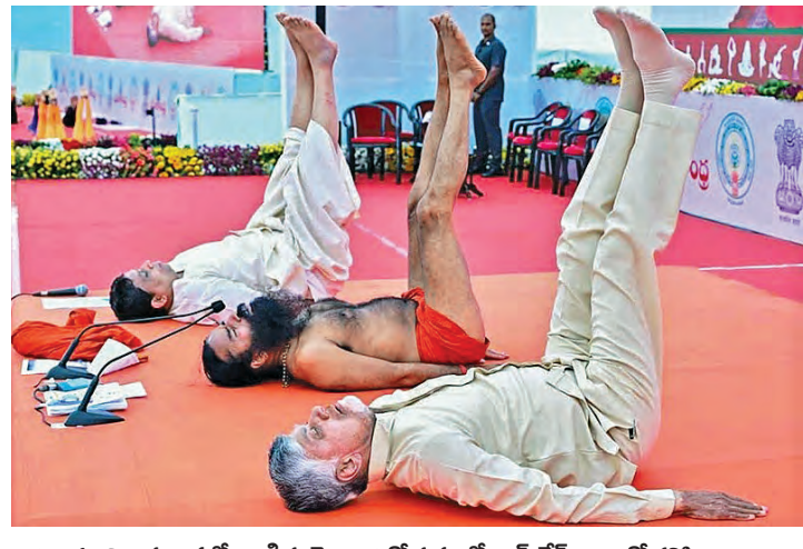
ఆదివారం విజయవాడలో జరిగిన యోగా దినోత్సవంలో రామదేవ్ బాబాతో కలిసి యోగాసనాలు చేసిన సిఎం చంద్రబాబు