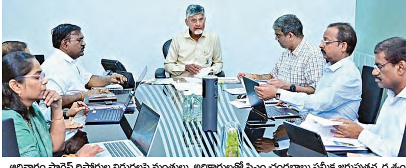
ఆదివారం ప్రోగ్రెస్ రిపోర్టుల విడుదలపై మంత్రులు, అధికారులతో సిఎం చంద్రబాబు సమీక్ష జరుపుకున్న దృశ్యం

నేటి నుంచి కీలకాంశాలపై నివేదికలు విడుదల 4 అంశాలపై స్వయంగా లివీజీ చేయనున్న సిఎం చంద్రబాబు విజయవాడ, జూన్ 21, ప్రభాతవార్త ప్రతినిధి: ప్రజా ప్రభుత్వం సాధించిన విజయాల ప్రజల్లోకి తీసుకువెళ్లేందుకు ప్రజా ప్రభుత్వ రెండేళ్ల పాలనపై ప్రగతి నివేదిక 2024-26 పేరుతో విడుదల చేయాలని సిఎం చంద్రబాబు నాయుడు మంత్రులు, అధికారులను ఆదేశించారు. 2024లో అధికారం చేపట్టిన వెంటనే గత ప్రభుత్వ పాలనలో జరిగిన విద్యనంపై ఇచ్చిన 7 శ్రేణి పత్రాలపై యాక్షన్ ప్లాన్ రిపోర్టు ఈ ప్రోగ్రెస్ రిపోర్టులు ఉండాలన్నారు. 7 శ్రేణి పత్రాలతో పాటు... మరో 3 ముఖ్యమైన అంశాలపై ప్రోగ్రెస్ రిపోర్టుల విడుదల చేయాలని నిర్ణయించారు. ప్రోగ్రెస్ రిపోర్టుల విడుదలపై మంత్రులు, అధికారులతో క్యాంపు చేపట్టిన వెంటనే గత ప్రభుత్వ పాలనలో జరిగిన