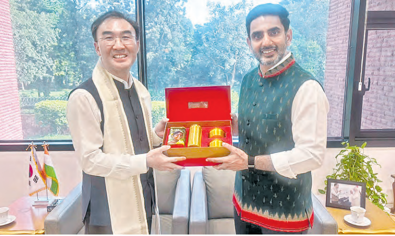
సోమవారం ఢిల్లీలో దక్షిణ కొరియా రాయబారి రీ సియోంగ్ హోతో మంత్రి లోకేశ్ ఖేటి లయన దృశ్యం