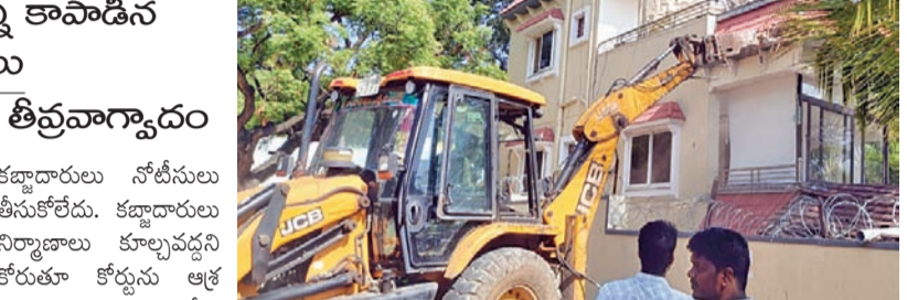
మంచినీటిపారుదల వద్ద మూసీ బఫర్ జోన్ లో వెలిసిన భారీ నిర్మాణాలను కూల్చివేస్తున్న రెవెన్యూ అధికారులు

అధికారులు, కర్ణాటక మండల తీర్మానాలు హైదరాబాద్ (నాల్గోంగి), జూన్ 22, ప్రభాతవార్త : కర్ణాటక నోటీసులు తీసుకోలేదు. కర్ణాటక రంగారెడ్డి జిల్లా గండిపేట మండలం మంచినీటిపారుదల గ్రామం వద్ద మూసీ బఫర్ జోన్లో వెలిసిన ఆక్రమ నిర్మాణాలను రెవెన్యూ అధికారులు నేల పట్టు చేశారు. సోమవారం ఉదయం నాల్గోంగి పోలీసులు బండ్లబస్సు మధ్య గండిపేట తహసీల్దార్ శ్రీనివాసరెడ్డి ఆడితూ మేరకు రెవెన్యూ సిబ్బంది ఆక్రమ నిర్మాణాలను జేసీబీలతో కూల్చి వేశారు. మంచినీటిపారుదల గ్రామం వద్ద నెలవారీ 326, 327, 328, 329లలో ఉన్న ఎకరం ప్రభుత్వ భూమిని అధికార పార్టీకి చెందిన బడా నేత, మరీకోంటే మంది కలిసి కట్టా చేసి, నిర్మాణాలు చేపట్టి ఓ ప్రైవేటు పాఠశాలకు 10 సంవత్సరాలకు గాను లీజుకు ఇచ్చారు. నెలకు రూ.లక్ష ఆర్డీ తీసుకుంటున్నారు. విషయం తెలుసుకున్న గండిపేట కట్టడాలు అధికారి బఫర్ జోన్లో వెలిసిన కట్టడాలు కట్టడాలు విరుద్ధమైనవని, నాటిని తొలగించాలని కర్ణాటక సూచించారు. కట్టడా చేసి నిర్మాణాలు చేపట్టిన వారిలో ఒకరు ప్రభుత్వంలో పలుకుబడి ఉన్న బడా నాయకుడు కావడంతో మీ నిర్మాణాలు కూల్చివేస్తున్నామని అధికారులు నోటీసులు ఇచ్చేందుకు వెళ్లారు.