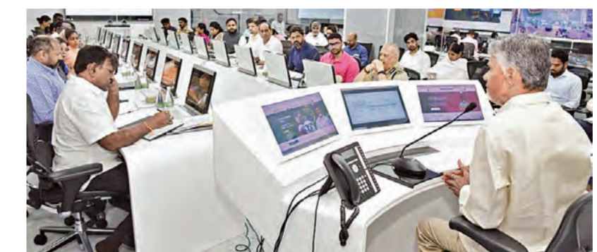
అదివారం సచివాలయంలో ఆర్టిజిఎస్ సమావేశంలో సిఎం చంద్రబాబు విజయవాడ, జూన్ 22, ప్రభాతవార్త ప్రతినిధి: అనుమానంతో అగ్ని ప్రమాదం వల్ల మృత్యువు వస్తూ, అధికారులు సాఫ్ట్ సిల్కీ అవుగ్నిస్తామని సిఎం చంద్రబాబు నాయుడు సుప్రం చేశారు. షిజిఆర్ఎస్ సహా ప్రజలనుంచి వచ్చే అల్లె

వివిధ శాఖల పని తీరుపై సమీక్షించారు. ఈ సందర్భంగా ముఖ్యమంత్రి మాట్లాడుతూ... అల్లె దారుల స్థానంలో ఉండి ఫిర్యాదుల పరిష్కారంపై దృష్టి సారించాలి. సమస్య పరిష్కారం కోసం అధికారులు, ఉద్యోగుల వద్దకు వచ్చే పౌరులతో సామ్యంగా వ్యవహరించాలి. దీని ద్వారా పాలసై ప్రజల్లో మంచి భావన కలుగుతుంది. మానవ వనరులను సద్వినియోగం చేసుకోవాలి. ఎప్పుడైతే ఉద్యోగులు పాలసై పరంగా సామ్యంగా వెంటకొవాలి. మూడున్నెండు కాలానికి అనుగుణంగా పని విధానం మార్చుకోవాలి. క్షేత్ర స్థాయిలో పర్యవేక్షణ వాస్తవ పరిస్థితులకు అనుగుణంగా నిర్ణయాలు తీసుకోవాలి. మంత్రులు, అధికారులు, ఉద్యోగులు క్షేత్ర స్థాయి పర్యవేక్షణ ప్రాధాన్యమివ్వాలి. ఎవరి బలమైన మానవ వనరుల వ్యవస్థ అవసరం. పాలసై సంస్కరణలపై ఉద్యోగులకు, అధికారులకు శిక్షణ >>2