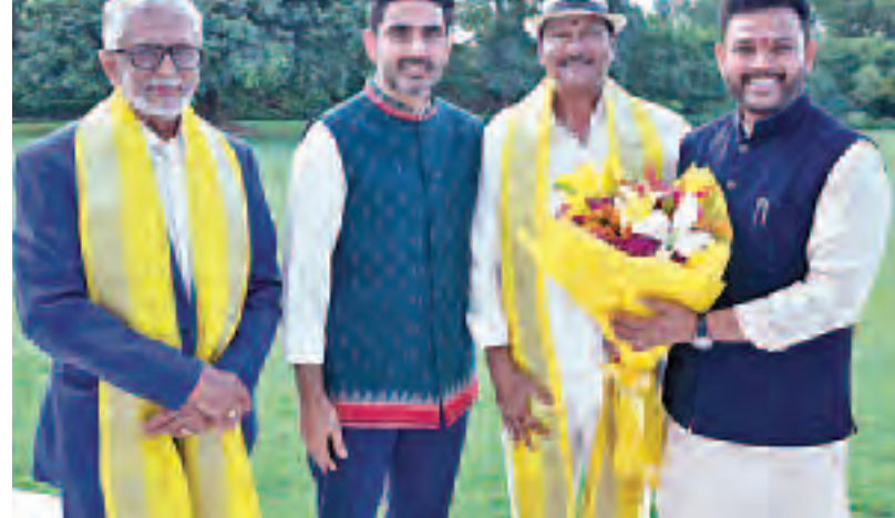
పద్మశ్రీ అవార్డులను అందుకోలేతున్న మురళీమోహన్, రాజేంద్రప్రసాద్ లోకేశ్ మంత్రి నారా లోకేశ్, కేంద్ర మంత్రి రామోజినాయుడు

నేడు పద్మశ్రీ అవార్డులు స్వీకరించనున్న కథానాయకులు