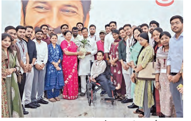
సిఎం ప్రజావాణిని సంబంధించిన మధ్యప్రదేశ్ రాష్ట్ర ట్రైని డిప్యూటీ కలెక్టర్లు

ఈ సందర్భంగా రాష్ట్రానికి సంబంధించిన కీలక ప్రాజెక్టులు, రైతాంగ ప్రయోజనాలకు సంబంధించిన పలు అంశాలపై కేంద్ర ప్రభుత్వానికి వివరించాలని సమర్పించారు. తెలంగాణలో అయిల్ పామ్ సాగు విస్తరణ, రైతుల ప్రయోజనాల పరిరక్షణ, దేశీయ పంటనూనెల ఉత్పత్తి పెంపుపై విస్తృతంగా చర్చించారు. నేషనల్ మిషన్ ఆన్ ఎడిబిల్ అయిల్ అయిల్ పామ్ లక్ష్యాలను అత్యంత సమర్థవంతంగా అమలు చేస్తున్న తెలంగాణ దేశంలోనే అగ్రస్థానంలో నిలిపివేసే తుమ్మల అన్నారు. రాష్ట్రంలో ఇప్పటికే సుమారు 3 లక్షల ఎకరాల్లో అయిల్ పామ్ సాగు విస్తరించగా, 70 వేల ఎండ్‌టెక్టా రైతులు ఈ పంటను సాగు చేస్తున్నారని తెలిపారు. రాష్ట్రంలో మూడేళ్లలో ఈ విస్తీర్ణాన్ని 10 లక్షల ఎకరాలకు పెంచే లక్ష్యం ప్రభుత్వం ఉంచినట్లు తెలిపారు. ఇటీవల క్రాఫ్ పామాయిల్‌పై దిగుమతి సుంకాన్ని 44 శాతం నుంచి 16 శాతానికి తగ్గించడం వల్ల దేశీయ అయిల్ రైతులు తీవ్రంగా నష్టపోతున్నారని అందోళన వ్యక్తం చేశారు. దిగుమతి సుంకం తగ్గింపుతో విదేశాల నుంచి చౌక ధరలకు పామాయిల్ దిగుమతులు పెరిగి దేశీయ మార్కెట్లో ధరలు పడిపోతున్నాయని, దీనివల్ల అయిల్ పామ్ రైతులు ఉత్పత్తి చేస్తున్న ప్రైవేట్ ప్రాజెక్ట్ బండ్ లకు గిట్టకపోతూ ధర లభించడం లేదని వివరించారు. దీర్ఘకాలిక పంట అయిన అయిల్ పామ్ సాగుకు రైతుల భారీగా పెట్టుబడులు పెడుతున్న నేపథ్యంలో ధరల అనిశ్చితి రైతుల్లో అందోళన కలిగిస్తోందన్నారు.