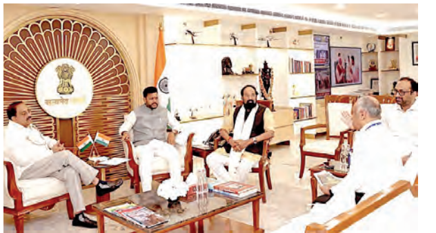
అయిల్‌పామ్ రైతులకు రక్షణ కల్పించాలి