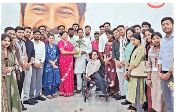
సిఎం ప్రజావాణిని సంబంధించిన మధ్యప్రదేశ్ రాష్ట్ర ట్రైని డిప్యూటీ కలెక్టర్లు

ఈ సందర్భంగా రాష్ట్రానికి సంబంధించిన కీలక ప్రాజెక్టులు, రైతాంగ ప్రయోజనాలకు సంబంధించిన పలు అంశాలపై కేంద్ర ప్రభుత్వానికి వివరించడాలు సమర్పించారు. తెలంగాణలో అయిల్ పామ్ సాగు విస్తరణ, రైతుల ప్రయోజనాల పరిరక్షణ, దేశీయ పంటనుండి ఉత్పత్తి పెంపుపై విస్తృతంగా చర్చించారు. నేషనల్ మిషన్ ఆన్ ఎడిబిల్ అయిల్ అయిల్ పామ్ లక్ష్యాలను అత్యంత సమర్థవంతంగా అమలు చేస్తున్న తెలంగాణ దేశంలోనే అగ్రస్థానంలో నిలిచేందుకు తుమ్మల అన్నారు. రాష్ట్రంలో ఇప్పటికే సుమారు 3 లక్షల ఎకరాల్లో అయిల్ పామ్ సాగు విస్తరించగా, 70 వేల ఎండ్‌డిపైగా రైతులు ఈ పంటను సాగు చేస్తున్నారని తెలిపారు. రాష్ట్రంలో మూడేళ్లలో ఈ విస్తీర్ణాన్ని 10 లక్షల ఎకరాలకు పెంచే లక్ష్యం ప్రభుత్వం ఉంచినట్లు తెలిపారు. ఇటీవల క్రాఫ్ట్ పాములపై దిగుమతి సుంకాన్ని 44 శాతం నుంచి 16 శాతానికి తగ్గించడం వల్ల దేశీయ అయిల్ పామ్ రైతులు తీవ్రంగా నష్టపోతున్నారని అందోళన వ్యక్తం చేశారు. దిగుమతి సుంకం తగ్గింపుతో విదేశాల నుంచి చౌక ధరలకు పాముల దిగుమతులు పెరిగి దేశీయ మార్కెట్లో ధరలు పడిపోతున్నాయని, దీనివల్ల అయిల్ పామ్ రైతులు ఉత్పత్తి చేస్తున్న ప్రైవేట్ ప్రాజెక్ట్ బండ్ లకు గిట్టబాటు ధర లభించడం లేదని వివరించారు. దీర్ఘకాలిక పంట అయిన అయిల్ పామ్ సాగుకు రైతుల భారీగా పెట్టుబడులు పెడుతున్న నేపథ్యంలో ధరల అనిశ్చితి రైతుల్లో అందోళన కలిగిస్తోందన్నారు.