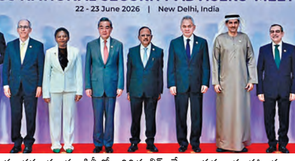
మంగళవారం న్యూఢిల్లీలో జరిగిన బ్రిక్స్ దేశాల భద్రతా సలహాదారుల సమావేశంలో పాల్గొన్న ఎన్ఎస్ఎ అజిత్ దోవల్

మెరుగుదలలు తీసుకురావడం కూడా బ్రిక్స్ లక్ష్యాలలో భాగమని చెప్పారు. ఉగ్రవాద నిరోధక అంశాలపై బ్రిక్స్ సయోజ్య వర్కింగ్ గ్రూపుల నివేదికలపై కూడా ఈ సమావేశంలో చర్చ జరగనుందని ఆయన తెలిపారు. సంప్రదాయక భద్రతా ముప్పులు జాతీయ సరిహద్దుల దాటి విస్తరిస్తున్నాయని, విద్యుత్ సాంకేతికత వల్ల కొత్త సవాళ్ల ఉత్పన్నమవుతున్నాయని హెచ్చరించారు. ఈ కొత్త అవరోధాలను సవాళ్లను సమష్టిగా ఎదుర్కోవే మార్గాలపై సమావేశంలో మిస్ట్రే చర్చలు జరగనున్నాయని దోవల్ వెల్లడించారు.