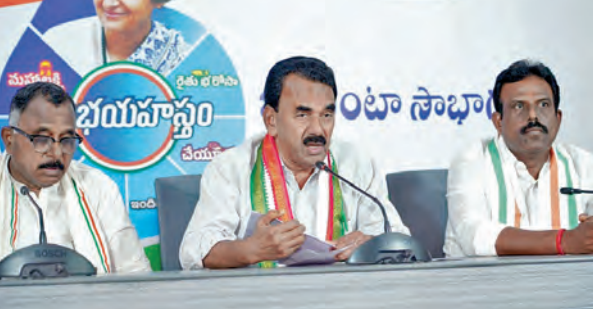
హైదరాబాద్, జూన్ 23, ప్రభాతవార్త: రైతు భరోసా