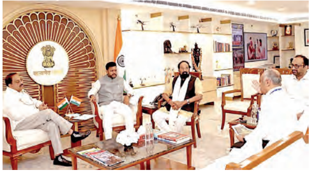
అయిల్‌పామ్ రైతులకు రక్షణ కల్పించాలి