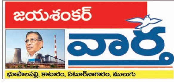
భూపాలపల్లి, కాటారం, ఏటూర్ నాగారం, ములుగు