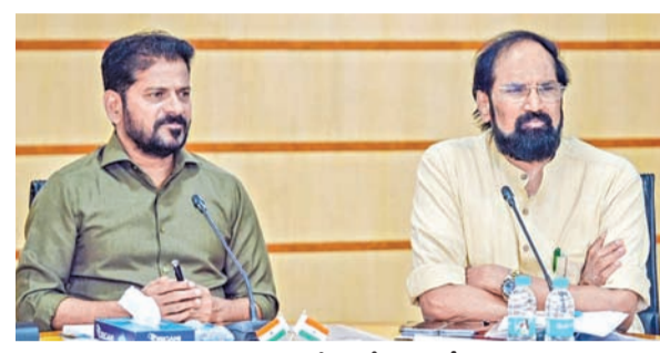
తుంగభద్ర జలాలపై జరిపిన సమీక్షలో సిఎం రేవంత్, మంత్రి ఉత్తమ్

ప్రభాతవార్త ప్రధాన ప్రతినిధి, హైదరాబాద్, జూన్ 24: తుంగభద్ర నుంచి మన రాష్ట్రానికి రావాల్సిన నీటి వాటా జలాల వినియోగానికి.. భాగస్వామ్య రాష్ట్రాలతో సమన్వయం సాధనకు కేంద్ర ప్రభుత్వం జోక్యం చేసుకోవాలని ముఖ్యమంత్రి ఎ.రేవంత్ రెడ్డి విజ్ఞప్తి చేశారు. తుంగభద్ర డ్యామ్, నది ప్రవాహం నుంచి తెలంగాణకు హక్కుగా 15.9 టీఎంసీల నీరు రావాల్సి ఉంది. ఇప్పుడు అయిదారు టీఎంసీలకు మించి రావడం లేదని ముఖ్యమంత్రి ఆందోళన వ్యక్తం చేశారు. ఆర్డీఎస్ కింద జోగులాంబ గద్దాల జిల్లాలో దాదాపు 75 గ్రామాల్లో 83,987 ఎకరాల ఆయకట్టుకు నీరు అందాల్సి ఉంది. మూడు రాష్ట్రాల భాగస్వామ్యం ఉన్నందున కేంద్ర జల సంఘం ఆధ్వర్యంలో తెలంగాణ, ఏపీ, కర్ణాటక నీటి వాటాల సమర్థ వినియోగానికి కేంద్ర జల సంఘం (సిడబ్ల్యుసి) సారథ్యంలో తుంగభద్ర బోర్డ్ ను పటిష్ఠం చేయాలని కోరారు. బుధవారం సాయంత్రం జలసౌధలో తుంగభద్ర ప్రాజె