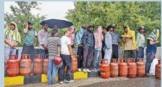
ధర్మశాలలో బుధవారం గ్యాస్ కోసం భారీ క్యూలైన్లో ప్రజలు