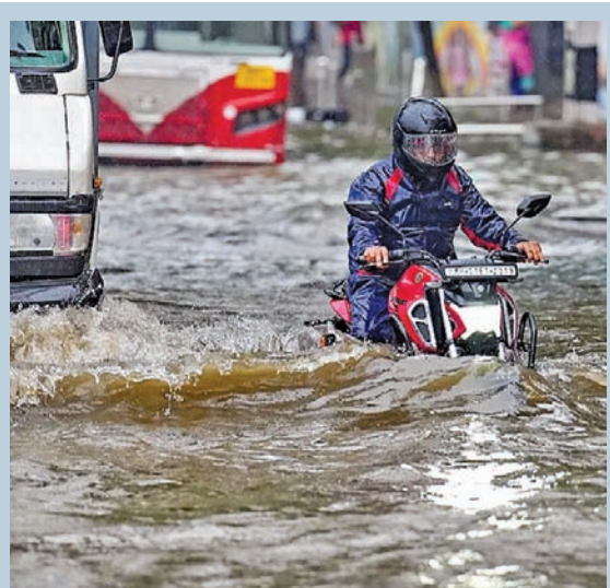
ముంబయిలో బుధవారం కురిసిన భారీ వర్షానికి సమాములతుకు నీటిలో ప్రయాణిస్తున్న ఖైకర్