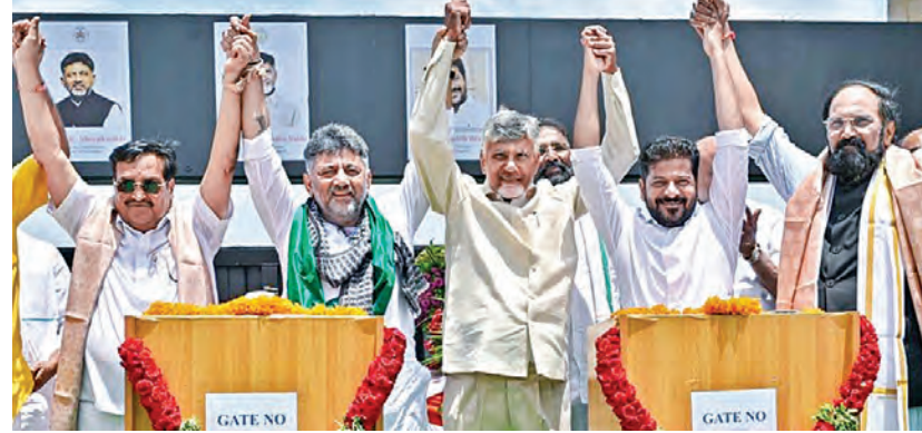
తుంగభద్ర గేట్లను తెరిచిన అనంతరం కేంద్ర మంత్రి సిఆర్ పాటిల్ తో కలిసి సంఘీభావం ప్రకటించిన ముగ్గురు సీఎంల రేవంత్ రెడ్డి, చంద్రబాబు, డి3 శివకుమార్. చిత్రంలో మంత్రి ఉత్తమ

కారకాన్, జూన్ 25: వెనిజులా కరీబియన్ తీరప్రాంతంలో బుధవారంసాయంత్రం సంభవించిన రెండు వరుస భారీ భూకంపాలు ఆ దేశాన్ని వణికించాయి. రాజధాని కారకాన్ సహా పలు నగరాల్లో భూమి కంపించడంతో అనేక భవనాలు కుప్పకూలాయి. భారీ ఆస్తి నష్టం సంభవించడంతో పాటు కరీబియన్ >>2