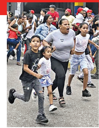
కారకాన్ లో పరుగులు తీస్తున్న ప్రజలు

రాజధాని, మరికొన్ని నగరాల్లో నేలకొరిగిన భవనాలు, హోటళ్లు ఆకాశం నిండిపోయిన ధూళి మేఘాలు