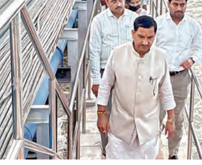
నాగోల్ మురుగునీటి శుద్ధి కేంద్రాన్ని సందర్శిస్తున్న కేంద్ర గృహనిర్మాణ, పట్టణ వ్యవహారాల శాఖ సహాయమంత్రి టోకెన్ సాహు