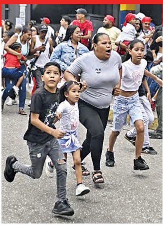
కారకాన్‌లో పరుగులు తీస్తున్న ప్రజలు

రాజధాని, మరికొన్ని నగరాల్లో నేలకొరిగిన భవనాలు, హోటళ్లు ఆకాశం నిండిపోయిన ధూళి మేఘాలు