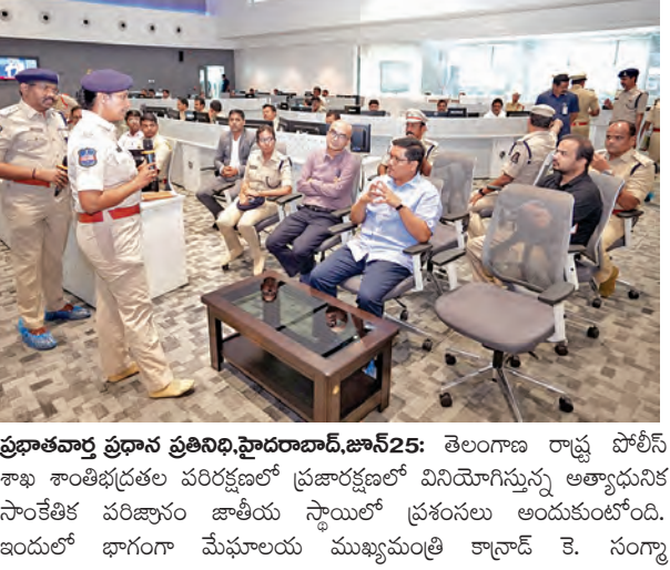
ప్రభాతవార్త ప్రధాన ప్రతినిధి, హైదరాబాద్, జూన్ 25: తెలంగాణ రాష్ట్ర పోలీస్ శాఖ శాంతిభద్రతల పరిరక్షణలో ప్రజాక్షేత్రంలో వినియోగిస్తున్న ఆట్యానుని సాంకేతిక పరిజ్ఞానం జాతీయ స్థాయిలో ప్రదర్శనలు అందుకుంటోంది. ఇందులో భాగంగా మేఘాలయ ముఖ్యమంత్రి కామాండ్ కె. సంగ్మా