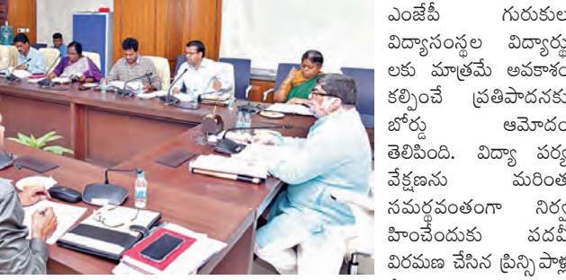
ఎంజెపీ గురుకుల విద్యాసంస్థల విద్యార్థులకు మాత్రమే అవకాశం కల్పించే ప్రతిపాదనకు బోర్డు ఆమోదం తెలిపింది. విద్యా వర్గ వేక్షణను మరింత సమర్థవంతంగా నిర్వహించేందుకు వడదీ విరమణ చేసిన ప్రైవేట్ పాస్టల్ సేవలను అడవమీకే

అలాగే 2023 నుంచి పెండ్లింగ్లో ఉన్న సుమారు రూ.7.5 కోట్ల మరమ్మతు బిల్లులను ప్రాధాన్యతతో క్షీయల్ చేయాలని ఆర్థిక శాఖ అధికారులకు ఉప ముఖ్యమంత్రి సూచించారు. సంక్షేమ గురుకులాల, హాస్టల్ రెంట్ ఛార్జీలు, డ్రైట్, కాన్స్ట్రక్టివ్ ఛార్జీలకు సంబంధించిన బిల్లులను ఎప్పటికప్పుడు పైసాస్ డిపార్ట్ మెంటుకు పంపాలని ఆయా శాఖ కార్యదర్శులకు ఉప ముఖ్యమంత్రి ఆదేశాలు జారీ చేశారు. స్టడీ సెల్స్ కు బలోపేతం చేసి, యూపీఎస్సీ, గ్రూప్ సర్వీసులు, ఇతర పోటీ పరీక్షల్లో విజయశాసనాన్ని పెంచాలన్నారు. సంక్షేమ శాఖలకు సంబంధించి పెండ్లింగ్లో ఉన్న అన్ని బిల్లులను సమర్పించాలని ఆదేశించారు. మెరుగైన ఆర్థిక ప్రణాళిక కోసం వార్షిక, త్రిమాసిక నిధుల అవసరాలను సమర్పించాలని తెలిపారు.