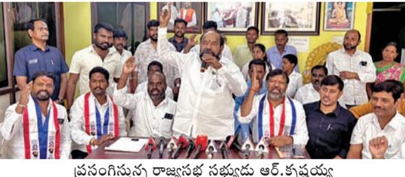
ప్రసంగిస్తున్న రాజ్యసభ సభ్యుడు ఆర్. కృష్ణయ్య