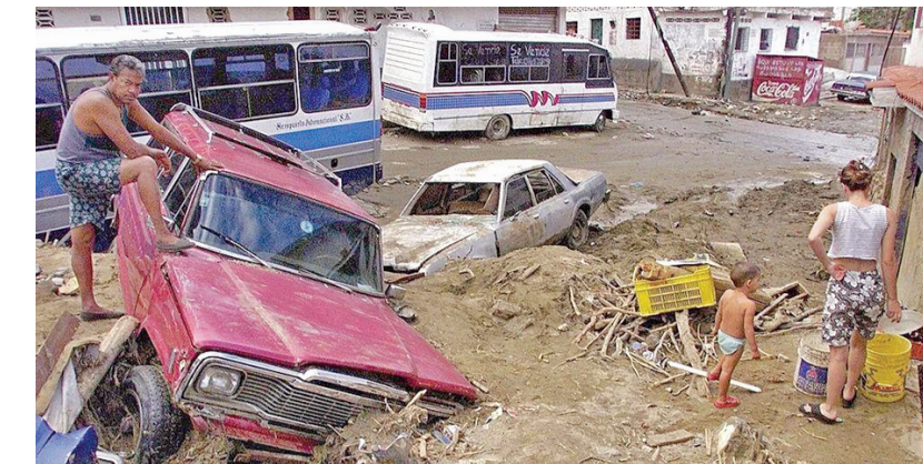
వెనిజులాలో భూకంపంపాటికి మట్టిలో కూరుకుపోయిన కార్లు

సిబ్బందిని వర్తమానంలోంచి సుభాషినని, విరాళాలను దుర్గసియోగం చేయడంలో అతనే కీలక పాత్ర పోషించాడని ఆరోపణలు ఉన్నాయి. ఈ నేర విధానానికి సంబంధించి, ప్రజల కంట పడకుండా ఉండేందుకు మొదట నగదు కట్టలను బాత్రూమ్లో దాచి, ఆ తర్వాత రాత్రివేళ ఆలయ ప్రాంగణం నుండి బయటకు తరలించినట్లు సమాచారం. ఆ తర్వాత, దొంగలించిన డబ్బును వేర్వేరు ప్రాంతాల్లో వేరు చేసి, మోసాగళ్ల ఖాతాల్లోకి మళ్లించారు. ఈ మూల గత 23 రోజులుగా ఈ కార్యకలాపాలు సాగిస్తున్నట్లు భావిస్తున్నారు. దోషులను వదిలేదిలేదు: సిఎం యోగ్ రామమందిర విరాళాల వివాదంలో దోషులుగా తేలిన వారిపై కఠిన చర్యలు తీసుకుంటామని ఉత్తరప్రదేశ్ ముఖ్యమంత్రి యోగ్ ఆదిత్యనాథ్ శుక్రవారం మరోసారి స్పష్టం చేశారు. ప్రత్యేక దర్యాప్తు బృందం (సిట్) ప్రాథమిక నివేదిక సమర్పించిన వెంటనే చర్యలు మొదలయ్యాయని, దోషులు చట్టం ముందు నిలబడతామని సమాచారం. దోషులు చట్టం ముందు నిలబడతామని హామీ ఇచ్చారు. జూన్ 19న అయోధ్యలో పర్యటించినప్పుడు దర్యాప్తు తర్వాత చర్యలు తీసుకుంటామని తాను చెప్పినట్లు, ఆ 'శిక్షా ప్రక్రియ' ఇప్పటికే మొదలైందని సిఎం పేర్కొన్నారు.