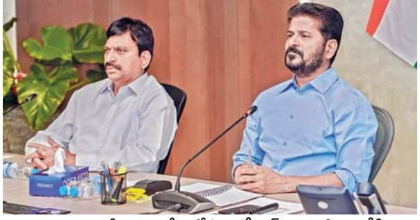
శుక్రవారం సమీక్ష సమావేశంలో సిఎం రేవంత్, మంత్రి పొంగులేటి

నెక్లెస్ రోడ్డులో మూసీ ఎక్స్ పీరియన్స్ సెంటర్ ఏర్పాటు తీరం పొడవునా వ్యాపార సముదాయాలు, వ్యాపార కేంద్రాలు నదిలో నిత్యం మంచినీటి ప్రవాహం మొదటి దశలో 9 కి.మీ. పరిధిలో పనులు: సమీక్షలో సిఎం రేవంత్ రెడ్డి