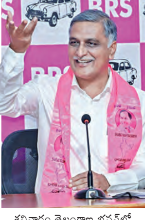
శనివారం తెలంగాణ భవన్ లో మీడియాతో హాంపెరావు

ఆయన్ని బయట కూర్చో బెట్లతో సీకెట్ల ఏముంది? తెలంగాణ నీటి హక్కులు హరిస్తుంటే చూస్తూ ఉర్రుకోం: వారీష్ రావు