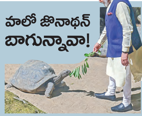
శనివారం సీషెల్స్ బొటానికల్ గార్డెన్ లో జోనాథన్ అనే తాబేలుకు ఆకులు తినిపిస్తున్న ప్రధాని మోడీ