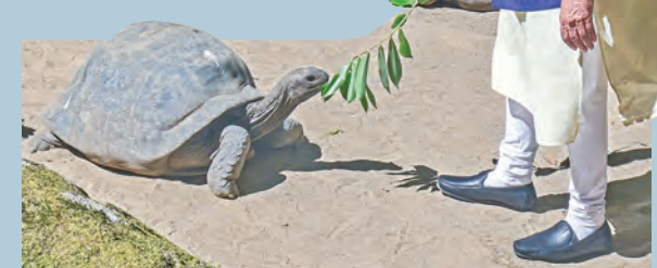
శనివారం సీషెల్స్ బొటానికల్ గార్డెన్ లో జొనాథన్ అనే తాబేలుకు ఆకులు తినిపిస్తున్న ప్రధాని మోడీ

సీషెల్స్ లో 194 యేళ్ల వృద్ధ తాబేలును పరామర్శించిన ప్రధాని