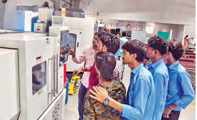
ఉట్నూర్ ప్రభుత్వ అత్యాధునిక బిజినెస్ సెంటర్లో శిక్షకుడితో విద్యార్థులు

నేతృత్వంలోని ప్రజా ప్రభుత్వం ఆందించిన ఆధునిక శిక్షణ, పరిశ్రమలకు అనుగుణంగా రూపొందించిన కోర్సులు, నిపుణుల మార్గదర్శకత్వం కీలక పాత్ర పోషించాయి. ప్రతిభకు అవకాశం కల్పిస్తే పల్లె యువత కూడా ప్రపంచ స్థాయిలో నత్తా చాలుగలరని ఉట్నూర్ విద్యార్థులు మరోసారి నిరూపించారు. పక్కా గ్రామీణ ప్రాంతమైన ఉట్నూర్ ఎటీసీలో శిక్షణ పొందిన మల్టీనేషనల్ కంపెనీలు నేరుగా ఎంపిక చేశాయి. మైదూర్ ఎలక్ట్రీక్ 47 మందికి, టాటా మోటార్స్ (ప్రజ్) 36 మందికి ఉద్యోగాలు ఇచ్చింది. అలాగే బెంగళూరులోని ఫ్యాక్టోరి ఆఫ్ ఇంటర్ డివిజన్ 14 మంది యువతులను ఎంపిక చేసింది. మంచి వేతన ప్యాకేజీలతో ఉద్యోగాలు రావడంతో వారి కుటుంబాల్లో కొత్త ఆశలు విగురించాయి. పల్లె నుంచి బెంగళూరు వరకు యువత ప్రయాణం సాధ్యమవుతుందనే నమ్మకాన్ని ఈ విజయగూఢ కల్పించింది. తెలంగాణ ప్రభుత్వం ప్రతిష్టాత్మకంగా ప్రారంభించిన నిర్వహిస్తున్న ఎటీసీలో విద్యార్థులకు ఇండ్లపై 4.0, సీఎన్సీ మెషిన్ గోల్డ్, రోబోటిక్స్, డిజిటల్ మాన్యువల్స్ గోల్డ్, ఎలక్ట్రీక్ వెహికల్స్, అత్యాధునిక సిమ్యులేషన్ బిజినెస్ వంటి ఆధునిక కోర్సుల్లో శిక్షణ అందిస్తున్నారు. ప్రస్తుతం