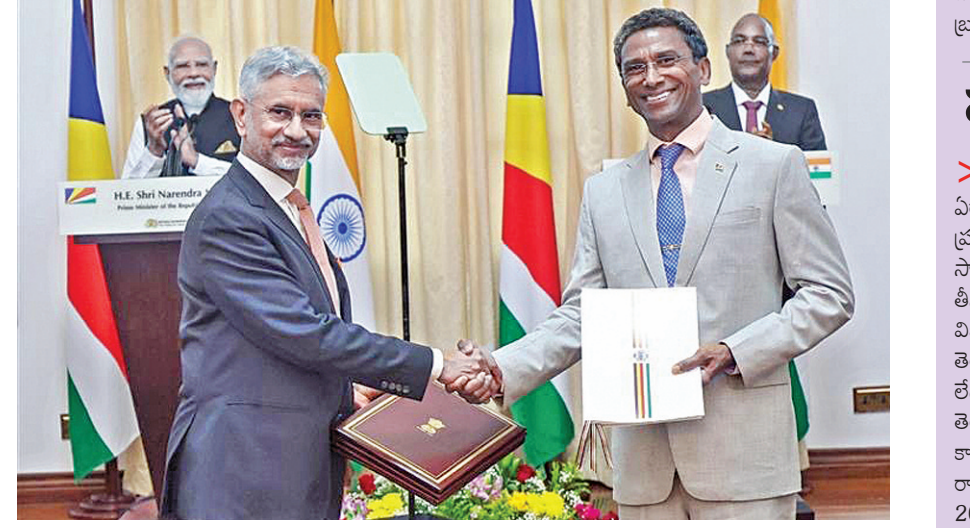
ఆదివారం విక్టోరియాలో ప్రధాని మోడీ, సీఎల్పీ అధ్యక్షుడు పాట్రిక్ సమక్షంలో ఒప్పంద ప్రత్యేక మార్పుకోటున్న ఇరు దేశాల విదేశాంగ మంత్రులు

రూ.78 వేల కోట్లతో తెలంగాణ రహదారుల రూపురేఖలు మారుస్తాం మంత్రి కోమటిరెడ్డి వెంకట్ రెడ్డి గత పదేళ్లలో నిర్వహించిన గురైన రహదారుల అభివృద్ధికి తమ ప్రజా ప్రభుత్వం అత్యంత ప్రాధాన్యత ఇస్తోందని మంత్రి కోమటిరెడ్డి వెంకట్ రెడ్డి అన్నారు. రాష్ట్ర నిధులతో రూ.6,500 కోట్ల వసూలతో పాటు కేంద్ర-రాష్ట్ర ప్రభుత్వాల నిధులు కలిపి సుమారు రూ.78 వేల కోట్లతో తెలంగాణ రహదారుల రూపురేఖలు మారుస్తున్నామని తెలిపారు. గత పదేళ్లలో కనీసం గుంతలు కూడా పూర్తిచేసి పరిస్థితి నుంచి నేడు తెలంగాణలో రహదారుల అభివృద్ధికి కొత్త ఊపిరి పోస్తున్నారని అన్నారు. ఆర్థిక ఇబ్బందులు ఉన్నప్పటికీ రాష్ట్ర ప్రభుత్వం రూ.6,500 కోట్ల నిధులను కేటాయించి రహదారుల అభివృద్ధి పనులను వేగవంతంగా చేపడుతోందని తెలిపారు. పరిశ్రమల స్థాపన, స్థానిక యువతకు ఉపాధి కల్పన లక్ష్యంగా ప్రతి మండల కేంద్రాన్ని జిల్లా కేంద్రంతో డబుల్ రోడ్ల ద్వారా అనుసంధానం చేస్తున్నామని చెప్పారు. దీంతో యువత సొంత ఊర్లోనే ఉపాధి పొందుతూ తల్లిదండ్రులను, వ్యవసాయాన్ని పనులకునే అవకాశం కలుగుతుందన్నారు. జిల్లాలలో సుమారు 50 వేల మంది ముస్లిం అవసరాలను దృష్టిలో ఉంచుకుని ప్రత్యేక పాఠశాల మంజూరు చేయాలని ప్రభుత్వాన్ని కోరారు. అగ్ను చివరి నాటికి ఎస్ఎల్ఓసీ సొరంగ మార్గం పనులు పూర్తిచేసి జిల్లాలో నాలుగు లక్షల ఎకరాలకు సాగునీరు అందిస్తామని తెలిపారు. గ్రేటర్ హైదరాబాద్ తర్వాత నల్లగండ్లలోనే అండర్ గ్రౌండ్ డ్రైనేజీ వ్యవస్థ ఉన్న నగరాన్ని అభివృద్ధి చెందించామని. ఎంఆర్ కాలన్ అభివృద్ధికి రూ.450 కోట్లు మంజూరు చేసినందుకు ముఖ్యమంత్రికి కృతజ్ఞతలు తెలుపుతూ, మరో రూ.500 కోట్లు కేటాయింపాలని విజ్ఞప్తి చేశారు.