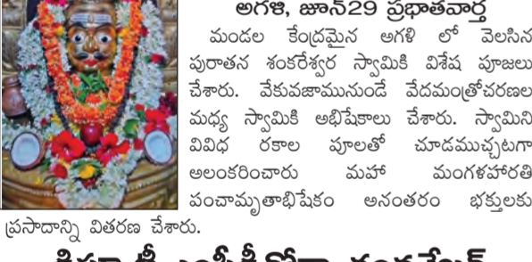
ప్రసాదాన్ని వితరణ చేశారు.