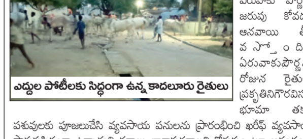
ఎదురుకు పార్లమి జరుపు కోవడం ఆనందాలు తీగ వ స ం డి ి ఏరువాక పార్లమి రోజు

డి.పి.ఎస్. జూన్ 29 ప్రభాతవార్త అన్నదాతలు భక్షిత్వంలో ఏరువాక పార్లమి వేడుకలను కుల, మత, రాజకీయాలతీతంగా ఘనంగా నిర్వహించారు. సోమవారం డి.పి.ఎస్.లో మండల పరిధిలోని ఆయా గ్రామాల రైతుల ఏరువాక పార్లమి పురస్కారం చుకొని ఎదురుకు సాంప్రదాయబద్ధంగా పూజలు నిర్వహించి ఎదురుకు పరగు వంటి పోటీను ఏర్పాటు చేశారు. ఖరీదైన కుముదు వస్త్రే ఏరువాక పార్లమి వ్యవసాయకుల ప్రతిష్టాత్మకంగా నిలబెట్టిన అన్నదాతలు ఆనందం, ఆనందాలు తీగ, సాంప్రదాయ కళల అద్దం వల్ల