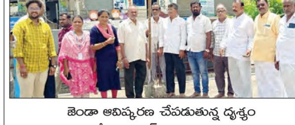
జెండా అభివృద్ధి చేపడుతున్న దృశ్యం

- గోరంట్ల సాస్టాల్లో ఘనంగా వారోత్సవాలు.. అధ్యక్షుని చేతుల మీదుగా జెండా అభివృద్ధి