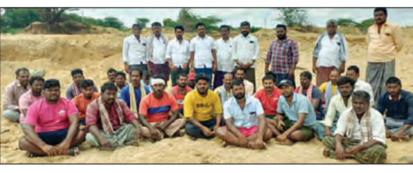
మాట్లాడుతున్న కార్మికులు, ట్రాక్టర్ యజమానులు

రామగిరి, జూన్ 29 ప్రభాతవార్త మాజీ ఎమ్మెల్యే ప్రకాష్ రెడ్డిపై ఐనుక ట్రాక్టర్ యజమానులు, కార్మికులు మండిపడ్డారు. సోమవారం పేరూరు సమీప గల పెన్నానదిలో ఐనుక వేసి కార్మికులు, ట్రాక్టర్ యజమానుల మధ్య, ప్రకాష్ రెడ్డి ఓ పత్రికలో పేరూరు ఏడో ఐనుకను అమ్ముతుంటున్నారని, కమిషన్లు తీసుకుంటున్నారని లేని పోని ఆరోపణలు చేసి మా కడుపుకొట్టారన్నారు. ఆయన ఆరోపణలకు రాష్ట్ర ఎమ్మెల్యే పరిటాల సునీత తీవ్రంగా హెచ్చరిస్తే ఎవర కమిషన్లు ఇచ్చారో ఎవరు అమ్ముతున్నారో అంతవరకు ఏటిలో ఐనుకను తోలరానిది హెచ్చరించారు. దీంతో 15 రోజులకు పైగా కులీలకు, ట్రాక్టర్ యజమానులకు పనులు లేక తీవ్ర ఇబ్బందులు పడుతున్నాయన్నారు. ఏటిలో ఐనుకను ప్రభుత్వ రోడ్డు, గృహ అవసరాలకు తప్పా కర్మాటకు కానీ ఎవరికీ అమ్మలేదన్నారు. ఇలాంటి లేని పోని ఆరోపణలు చేస్తే సీకేమైనా రాజమో అని ప్రకాశరెడ్డిని నిలదీశారు. మాట్లాడటంపై నిజానిజాలు తెలుసుకుని మాట్లాడాలని లేనిపోని ఆరోపణలు తీసుకుంటున్నారని లేని పోని ఆరోపణలు చేసి మా కడుపుకొట్టారన్నారు. ఆయన ఆరోపణలకు రాష్ట్ర ఎమ్మెల్యే పరిటాల సునీత తీవ్రంగా హెచ్చరిస్తే ఎవర కమిషన్లు ఇచ్చారో ఎవరు అమ్ముతున్నారో అంతవరకు ఏటిలో ఐనుకను తోలరానిది హెచ్చరించారు. దీంతో 15 రోజులకు పైగా కులీలకు, ట్రాక్టర్ యజమానులకు పనులు లేక తీవ్ర ఇబ్బందులు పడుతున్నాయన్నారు. ఏటిలో ఐనుకను ప్రభుత్వ రోడ్డు, గృహ అవసరాలకు తప్పా కర్మాటకు కానీ ఎవరికీ అమ్మలేదన్నారు. ఇలాంటి లేని పోని ఆరోపణలు చేస్తే సీకేమైనా రాజమో అని ప్రకాశరెడ్డిని నిలదీశారు. మాట్లాడటంపై నిజానిజాలు తెలుసుకుని మాట్లాడాలని లేనిపోని ఆరోపణలు చేయడం తగదన్నారు. ఇప్పటికైన రాష్ట్ర ఎమ్మెల్యే పరిటాల సునీత ఐనుకనుగూర్చి తోలుకోవడానికి ఆనుమతి ఇవ్వాలని వారు కోరారు.