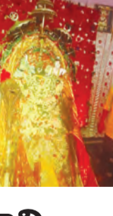
రుద్రవరం, జూన్ 29, ప్రభాతవార్త: మండల కేంద్రం రుద్రవరంలో సోమవారం మౌలాలి స్వామి జార్చులు ఘనంగా నిర్వహించారు.

రుద్రవరం, జూన్ 29, ప్రభాతవార్త: మండల కేంద్రం రుద్రవరంలో సోమవారం మౌలాలి స్వామి జార్చులు ఘనంగా నిర్వహించారు. గత కొన్ని ఏళ్లు నుండి అనవాయితీగా మొహరం పండుగ వేడుకలు పురస్కరించుకొని పండుగ ముగిసిన మూడవ దినం మౌలాలి స్వామి జార్చులను గ్రామపెద్దలు సంఘ సభ్యులు నిర్వహించారు. ఈ సందర్భంగా పలు గ్రామాలు నుండి వచ్చిన భక్తులందరూ స్వామివారిని కన్నులపీచిమంగా దర్శించుకుంటారు. అనంతరం గ్రామపెద్దలు దర్శనానికి వచ్చిన భక్తులందరికీ భోజనాలు ఏర్పాటు చేశారు. మౌలాలిస్వామి దర్శనంలోని పలు విషయాలకు ఊరేగింపు భక్తులకు దర్శనమిచ్చారు. అనంతరం భక్తులు స్వామివారికి ప్రత్యేక ఫలహారాలు నిర్వహించారు.