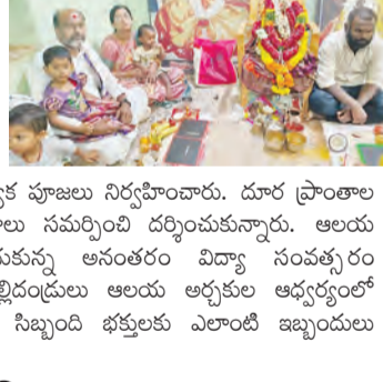
కోవల్లి, జూన్ 29, ప్రభాతవార్త: మండల పరిషత్లోని నల్లమల కొండల్లో వెలసిన కొలనుభారతి క్షేత్రంలో సోమవారం భక్తుల సందడి నెలకొంది.

కోవల్లి, జూన్ 29, ప్రభాతవార్త: మండల పరిషత్లోని నల్లమల కొండల్లో వెలసిన కొలనుభారతి క్షేత్రంలో సోమవారం భక్తుల సందడి నెలకొంది. కొలనుభారతి అమ్మవారిని అధిక సంఖ్యలో దర్శించుకున్నారు. అలయ అర్చకులు అమ్మవారికి చారు ఘోషిని నది జలాలతో జలాభిషేకం, కుంకుమార్చన, పుష్పార్చన మంగళహారతి వంటి ప్రత్యేక పూజలు నిర్వహించారు. దూర ప్రాంతాల నుండి వచ్చిన భక్తులు అమ్మవారికి కాదు కర్పూరాలను సమర్పించి దర్శించుకున్నారు. అలయ ప్రాంగణంలో ఉన్న సప్తశివాలయాలను దర్శించుకున్న అనంతరం విద్యా సంవత్సరం మొదలవడంతో 46 మంది చిన్నారులకు వారి తల్లిదండ్రులు అలయ అర్చకుల ఆధ్వర్యంలో ఓజ్జ్వలాలతో ఆక్షరాభ్యాసాలు చేయించారు. అలయ సిబ్బంది భక్తులకు ఎలాంటి ఇబ్బందులు లేకుండా ఏర్పాట్లు చేశారు.