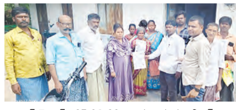
బిస్కెరి, జూన్ 29, ప్రభాతవార్త : మండల పరిషత్లోని బెల్లెన, కుందనగిరి గ్రామాలలో సోమవారం సాయంత్రం సర్ కార్యక్రమాన్ని బిఎల్.పి.లు పరిశీలించారు.