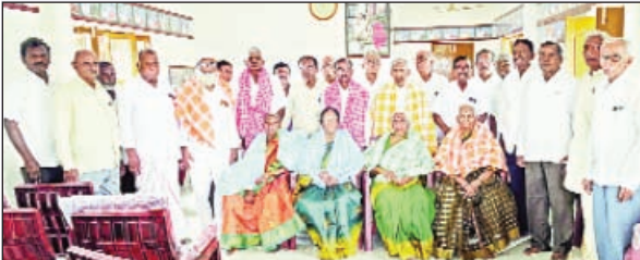
మునగాల , జూన్ 29, ప్రభాతవార్త :