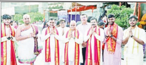
ప్రభావాలు తొలగి, ఆయురారోగ్యులతో పాటు సర్వ శుభఫలితాలు సిద్ధిస్తాయని ఆగమ పురాణాలు విశిడికరిస్తున్నాయి. ఈ సందర్భంగా జ్యేష్ఠాభిషేక సేవలో పాల్గొనడమైన భక్తులు తమ కుటుంబ సభ్యులతో కలిసి స్వామివారి దివ్య అను గ్రహాన్ని పొందాలని దేవాలయ నిర్వాహ కమిటీ సభ్యులు కోరారు.

భువనగిరి పట్టణ పరిధిలోని స్వర్ణగిరి శ్రీ వేంకటేశ్వర స్వామి దేవస్థానంలో జ్యేష్ఠ మాసం , జ్యేష్ఠా నక్షత్రాన్ని పురస్కరించుకుని నేడు పద్మావతి గోదాదేవి సమేత శ్రీ వేంకటేశ్వర స్వామివారి ఉత్సవమూర్తులకు మంగళవారం 108 కలశములతో జ్యేష్ఠాభిషేక మహోత్సవాన్ని అత్యంత వైభవోపేతంగా నిర్వహించ నున్నారు. జ్యేష్ఠ మాసం, జ్యేష్ఠా నక్షత్ర యోగంలో నిర్వహించే ఈ విశిష్ట సేవలో స్వామివారికి తిరు మంజనాభిషేకం నిర్వహించిన అనంతరం ప్రత్యేక అర్చనలు , మంగళహారతి సమర్పించబడుతుంది. ఈ మహోత్సవానికి హాజరై స్వామివారిని దర్శించుకునే భక్తులకు సకల గ్రహ దోషాలు, శత్రు బాధలు, దుష్ట శక్తుల