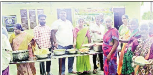
మునగాల , జూన్ 29, ప్రభాతవార్త :