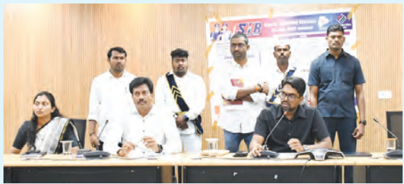
సమావేశంలో పాల్గొన్న జిల్లా కలెక్టర్ అధికారులు