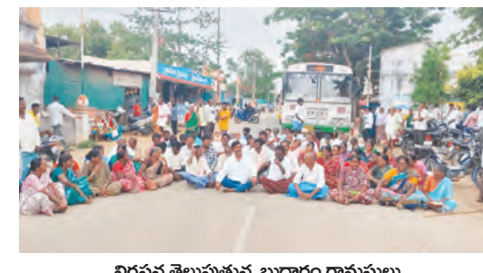
నిరసన తెలుపుతున్న బుద్ధారం గ్రామస్థులు

గోపాల్ పేట్ జూన్ 29 ప్రభాతవార్త : బుద్ధారం గ్రామంలో గ్రామస్థులు గురువారం చేపట్టిన రాస్తారోకో ఉద్యోగం దారితీసింది. తమ సమస్యలను పరిష్కరించాలని డిమాండ్ చేస్తూ స్థానికులు ప్రధాన రహదారిపై నిరసన చేపట్టారు. ప్రధాన డిమాండ్లు : డబ్బు బెన్డ్రూమ్ ఇండ్ల బిల్లులు మంజూరు గత ప్రభుత్వం మూడు సంవత్సరాల క్రితం మంజూరు చేసిన 40 డబ్బు బెన్డ్రూమ్ ఇండ్లకు సంబంధించి బిల్లులు ఇంతవరకు అందలేదని నిరసనకారులు ఆవేదన వ్యక్తం చేశారు. ప్రస్తుతం ఉన్న ప్రభుత్వం బిల్లు చేయడం టోకెన్లను జన రేట్ చేసినప్పటికీ, బిల్లుల చెల్లింపులో తీవ్ర నిరక్షణం వహిస్తుందని వారు ఆరోపించారు. ఇందిరమ్మ ఇండ్ల సమస్యలు ప్రభుత్వం ఇందిరమ్మ ఇండ్ల పథకంలో భాగంగా బిల్లు క్రియేట్ చేసినప్పటికీ, బిల్లుల మంజూరులో జాప్యం చేస్తూ నిరక్షణం వ్యవహరిస్తుందని గ్రామస్థులు మండిపడ్డారు. ఈ ఇండ్లకు సంబంధించిన బిల్లులను వెంటనే మంజూరు చేయాలని వారు ప్రభుత్వాన్ని డిమాండ్ చేశారు. రిజిస్ట్రారు భూములకు నష్టపరిహారం బుద్ధారం రిజిస్ట్రారు నిర్మాణం కోసం భూములు కోల్పోయిన రైతులకు ఇచ్చే నష్టపరి