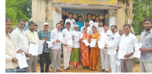
ఎన్యూఐఆర్ఎఫ్ ఫారూల పంపిణీ కార్యక్రమంలో పాల్గొన్న నాయకులు

అచ్చంపేట ఎమ్మెల్యే డా. చిక్కడపల్లి వంశీకృష్ణ ఉప్పునంతల, జూన్ 29 ప్రభాతవార్త : ప్రతి పౌరునికి ఓటు హక్కు ముఖ్యమని, అర్హతైన ప్రతి ఒక్కరికీ ఓటు ఉండే విధంగా బిఎల్ఎ లు కృషి చేయాలని అచ్చంపేట ఎమ్మెల్యే డా. చిక్కడపల్లి వంశీకృష్ణ అన్నారు. కేంద్ర ఎన్నికల సంఘం ప్రతిష్ఠాత్మకంగా నిర్వహిస్తున్న ఎన్ఐఆర్ సర్వే ఎన్యూఐఆర్ఎఫ్ పంపిణీ కార్యక్రమాన్ని గ్రామంలో నిర్వహిస్తున్న కార్యక్రమం పట్ల ప్రతి ఒక్కరూ జాగ్రత్తలు పాటించాలని, ఓటు అర్హత ఉన్న వారిని తొలగించకుండా బిఎల్ఎ లు జాగ్రత్తగా పని చేస్తూ బిఎల్ఓలకు సహకారించాలని ఆయన సూచించారు. 2002 సంవత్సరం ఓటర్ లిస్టులో ఉన్న వారి కుటుంబ సభ్యులు మ్యాజిస్ట్రేట్ ఆధారంగా ఎన్ఐఆర్ సర్వే నిర్వహించడం జరుగుతుందని ఆయన సూచించారు. గ్రామంలో అర్హతైన వారి ఓటు తొలిగి పోతుంటే జాగ్రత్తలు పాటించాలని బిఎల్ఎలకు, గ్రామస్థులకు సూచించారు. గ్రామంలో నిర్వహిస్తున్న ఎన్ఐఆర్ సర్వేలో గ్రామంలో నిజమైన ఓటు కలిగిన వారికి హక్కు లు ఉంటాయని ఎన్ఐఆర్, ఎన్యూఐఆర్ఎఫ్ ఫారూలు ప్రార్థి జాగ్రత్తలు పాటించాలని ఎమ్మెల్యే సూచించారు. గ్రామంలో ఎన్యూఐఆర్ఎఫ్ ఫారూలు పంపిణీ కార్యక్ర