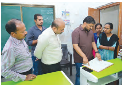
గురుకులంలో లాభాలను పరిశీలించు కలెక్టర్