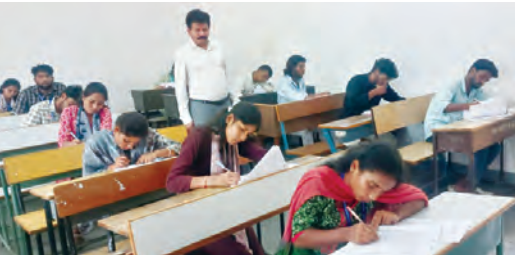
సెమిస్టర్ పరీక్షలు రాస్తున్న విద్యార్థులు