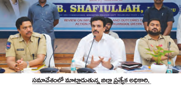
సమావేశంలో మాట్లాడుతున్న జిల్లా ప్రత్యేక అధికారి, రాష్ట్ర మైనారిటీ సంక్షేమ శాఖ కార్యదర్శి, సంక్షేమ శాఖ కమిషనర్ షఫీయుల్లా

రాష్ట్ర ప్రభుత్వం ప్రజలకు మరింత సమర్థవంతమైన పాలన అందించేందుకు, సంక్షేమ పథకాలను వేగంగా అమలు చేసేందుకు, అభివృద్ధి కార్యక్రమాలను క్షేత్రస్థాయిలో పర్యవేక్షించేందుకు రాష్ట్ర ప్రజాపాలన ప్రగతి ప్రణాళిక 99 రోజుల కార్యచరణ ప్రణాళిక ఎంతో విస్తృతమైన కార్యక్రమమని తెలిపారు. ఈ కార్యక్రమం ద్వారా ప్రభుత్వ శాఖల మధ్య సమన్వయం పెరగడంతో పాటు ప్రజలకు సేవలు మరింత వేగంగా అందుతున్నాయని, ప్రజాపాలన ప్రగతి ప్రణాళిక కింద జిల్లా వ్యాప్తంగా చేపట్టిన కార్యక్రమాలను సమీక్షించిన అనంతరం తనకు ఎంతో సంతోషం కలిగిందని షఫీయుల్లా తెలిపారు. జిల్లా కలెక్టర్ హేమంత్ కేసెవ్ పాటిల్ నాయకత్వంలో జిల్లా అధికారులు సమన్వయ పనిచేసి ప్రభుత్వం నిర్దేశించిన లక్ష్యాలను సమర్థవంతంగా అమలు చేస్తున్నారని కేసెవ్ అన్నారు. జిల్లా పోలీసు సూపరింటెండెంట్ - మగతా4లో..