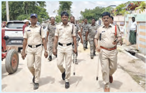
పెద్దపల్లె తల్లి పండుగ నేపథ్యంలో ప్రత్యేక బెటాలియన్ కమాండు నిర్వహిస్తున్న దృశ్యం