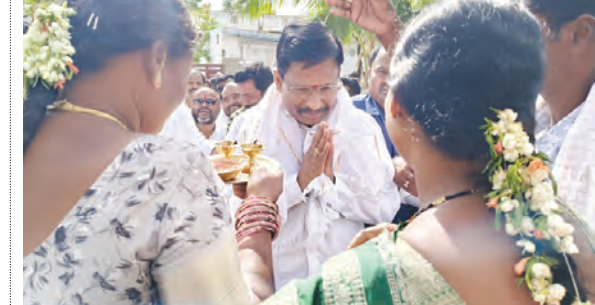
వివే కు స్వాగతం పలుకుతున్న మహిళలు