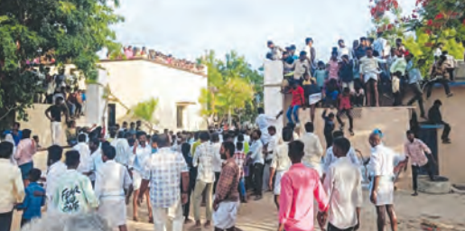
ఎడ్డుల ఊరేగింపు వేడుకలో

కెడీడొడ్డి జూన్ 29, ప్రభాతవార్త: మండల కేంద్రములో సోమవారం సాయంత్రం ఏరువాక పార్లమి పండుగ సందర్భంగా ప్రంజాలకు ఈత తాడు కట్టి ఎడ్డులతో వైభవంగా ప్రదర్శన సభాగీత తరలివచ్చిన గ్రామస్తులు, చైతానం గ్రామ సంస్కృతి, పురాతన వ్యవసాయ సాంప్రదాయాలను ప్రతిబింబించేలా కేడీడొడ్డి గ్రామ చావిడి వద్ద ఎడ్డుల ఊరేగింపు వేడుకను గ్రామస్తులు అత్యంత వైభవంగా, ఉత్సాహభరిత వాతావరణంలో నిర్వహించారు. సాంప్రదాయ ప్రకారం... గ్రామ చావిడి సమీపంలో ఉన్న ప్రంజాలకు ఈత తాడును గట్టిగా కట్టి, ఆ తాడు అవారంగా ప్రత్యేకంగా అలంకరించిన ఎడ్డులతో ఊరేగింపు కార్యక్రమాన్ని నిర్వహించారు. ఎడ్డుల బలాన్ని వాటి నైపుణ్యాన్ని ప్రదర్శించేలా సాగిన ఈ సాంప్రదాయ క్రతువు ప్రేక్షకులను ఎంతగానో ఆకట్టుకుంది. గ్రామానికి శుభం కలగాలని, వ్యవసాయం సరుగా సాగాలని కాంక్షిస్తూ ఏటా ఈ తరహా వేడుకలను నిర్వహించడం ఇక్కడి ఆనవాయితీగా వర్ధిల్లి అని గ్రామ పెద్దలు పేర్కొన్నారు. నేటి యాంత్రిక యుగంలో ఆంధరించబోతున్న జలాంటి గ్రామీణ సంస్కృతిని, క్రీడలను కాపాడుకోవాల్సిన బాధ్యత యువతపై ఎంతైనా ఉందని వారు