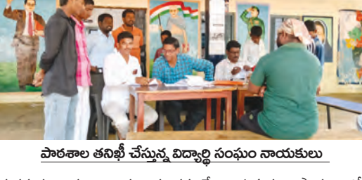
పాఠశాల తనిఖీ చేస్తున్న విద్యార్థి సంఘం నాయకులు