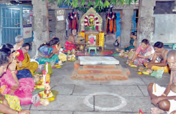
వరదరాజ స్వామి ఆలయంలో సత్యనారాయణ వ్రతం నిర్వహిస్తున్న ఆర్చుకుంటూ

కాణిపాకం, జూన్ 29 ప్రభాతవార్త: ప్రముఖ పుణ్యక్షేత్రమైన కాణిపాకం శ్రీమద్విద్య వినాయక స్వామి వారి ఆలయంలో సోమవారం సత్యనారాయణ వ్రతం శాస్త్రోక్తంగా ఆత్మంతు ఘనంగా నిర్వహించారు. ప్రధాన ఆలయం ఆనుబంధం ఆలయమైన శ్రీశ్రీవి భూదేవి సయితం వరదరాజస్వామి ఆలయంలో పౌర్ణమి సందర్భంగా ఈ ప్రత్యాన్ని నిర్వహించారు. ఆలయ మండపంలో ఈ ప్రత్యాన్ని ఆర్చుకుంటూ వేదపఠనం మంత్రోచ్ఛారణ నమమ ఘనంగా నిర్వహించారు. ఈమేరకు ముందుగా ఆలయంలో ఆర్చుకుంటూ, అమ్మవార్ల మూలవిరాళాలకు ఉడయం ప్రత్యేక అభిషేకాలు, ప్రత్యేక పరదరాజ స్వామి ఆలయంలో సత్యనారాయణ వ్రతం నిర్వహిస్తున్న ఆర్చుకుంటూ పూజలు నిర్వహించారు.