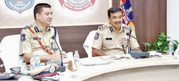
మంగళవారం టిఎస్ఎస్పి విభాగం ప్రధాన కార్యాలయంలో ఉన్నతాధికారులతో నిర్వహించిన సమీక్ష సమావేశంలో డిజిపి సివి ఆనంద్

స్టేషన్ పోలీసు బెటాలియన్ల ఉన్నతాధికారుల సమీక్షలో డిజిపి ఆనంద్