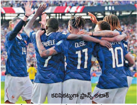
కలిసికట్టుగా ఫ్రాన్స్ లటాకే

న్యూఢిల్లీ, జూన్ 1 : హాట్ ఫేవరెట్, రెండు సార్లు ఛాంపియన్ ఫ్రాన్స్... ముఖ్యంగా మూడోసారి కప అందుకునే దిశగా సాకర్ ప్రపంచకపంలో దూసుకుపోతోంది. ఎంబాపే మ్యాజిక్ గోల్డ్ తో ఫ్రాన్స్ ట్రాన్స్ఫర్మేషన్ ప్రవేశించింది. నాకోల్తో స్వీడన్ ను 3-0 గోల్డ్ తో చిత్తు చేసింది. క్రైయన్ ఎంబాపే మరోసారి డబుల్ గోల్డ్ (45, 74వ నిమిషం)తో మెరవగా, డ్రాడ్లి బాల్కొలా (53వ నిమిషం) మరో గోల్డ్ సాధించాడు. ట్రాన్స్ఫర్మేషన్లో పరాగృతో ఫ్రాన్స్ తలవదనంది. మ్యాచ్ ప్రారంభం నుంచి ఫ్రాన్స్ ఆటాగో గేమ్ మొదలు పెట్టింది. పలుసార్లు స్వీడన్ గోల్డ్ గోల్డ్ దాడులు చేసింది. ఫ్రాన్స్ ఫార్వర్డ్ల స్పీడ్ కు స్వీడన్ వద్ద సమాధానం లేకపోయింది. మ్యాచ్