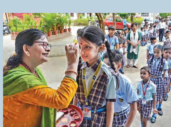
యూపిలోని మీర్జాపూర్లో పాఠశాలల పునఃప్రారంభం నేపథ్యంలో బుధవారం విద్యార్థులకు తిలకం దిద్ది స్వాగతిస్తున్న టీచర్లు