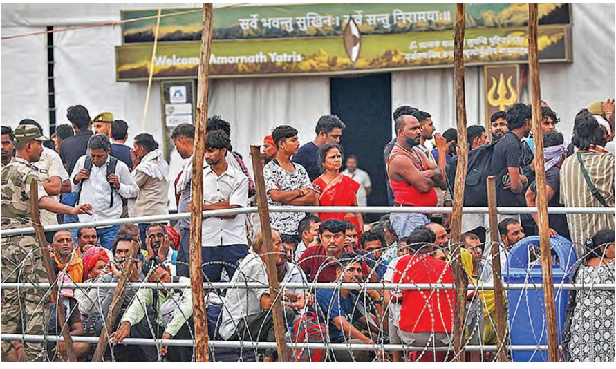
బుధవారం జమ్మూలో అమర్ నాథ్ యాత్ర రిజిస్ట్రేషన్ కోసం క్యూలో ఉన్న ప్రయాణికులు

ప్రభాతవార్త ప్రధాన ప్రతినిధి, హైదరాబాద్, జూలై 1: బెట్ సాల్వర్స్, కాంట్రాక్ట్ ఉద్యోగులకు జీతాల చెల్లింపు విషయంలో ముఖ్యమంత్రి ఎ.రేవంత్ రెడ్డి ఇచ్చిన హామీ నిలబెట్టుకున్నారు. రాష్ట్రంలోని ప్రభుత్వ శాఖలు, కార్పొరేషన్లు, సొసైటీలు, విశ్వవిద్యాలయాలు, ఇతర ప్రభుత్వ అనుబంధ సంస్థల్లో పనిచేస్తున్న బెట్ సాల్వర్స్, కాంట్రాక్ట్ సిబ్బందికి ఈ నెల మొదటి తేదీనే జీతాలు విడుదలయ్యాయి. ముఖ్యమంత్రి ఆదేశాల మేరకు ఆర్థిక శాఖ బుధవారం ఉద్యోగుల జీతాలను విడుదల చేసింది. జీతాల చెల్లింపులో ఆలస్యం వల్ల ఉద్యోగులు ఇబ్బందులు ఎదుర్కొంటున్నారని గుర్తించిన సీఎం రేవంత్ రెడ్డి ఈ ఆంశాన్ని తీవ్రంగా పరిగణించారు. చెర్నలర్ ఉద్యోగులతో పాటు కాంట్రాక్ట్, బెట్ సాల్వర్స్, హాసరేయిండ్ల ప్రాతిపదికన పనిచేస్తున్న సిబ్బందికి కూడా ప్రతి నెలా జీతాలు ఆలస్యం లేకుండా అందించాలని జివేశ్ రేవంత్ ఆదేశించారు. సీఎం ఆదేశాల అమలులో భాగంగా ఆర్థిక శాఖ జటిలమైన అన్ని శాఖలు, విభాగాలకు సర్దుబాటు జారీ చేసింది. జీతాల బిల్లుల సమర్పణ, పరిశీలన, ఆడిట్, అఖైజేషన్ లో జాప్యం రాకుండా ముందుకు చర్యలు తీసుకోవాలని స్పష్టమైన మార్గదర్శకాలు ఇచ్చింది. ప్రతి నెల 25వ తేదీలోగా జీతాలు, రెమ్యునరేషన్ బిల్లులను ట్రెజరీ, పే అండ్ ఆకౌంట్స్, ఆకౌంట్స్ విభాగాలకు సమర్పించాలని ఆదేశించింది. నెల చివరి పని దినానకల్లా పరిశీలన, ఆడిట్, ఆధైరజేషన్ ప్రక్రియ పూర్తిచేయాలని స్పష్టం చేసింది. ఈ ఆదేశాల అమలు.. జీతాల చెల్లింపు విషయంపై ముఖ్యమంత్రి బుధవారం ఆర్థిక శాఖ అధికారులను ఆరా తీశారు. ఈ నెల బిల్లులు అందించే విధాన విభాగాల ఉద్యోగులకు బుధవారం జీతాలు ఇవ్వ చేసినట్లు ఆర్థిక శాఖ అధికారులు ముఖ్యమంత్రికి నివేదించారు.