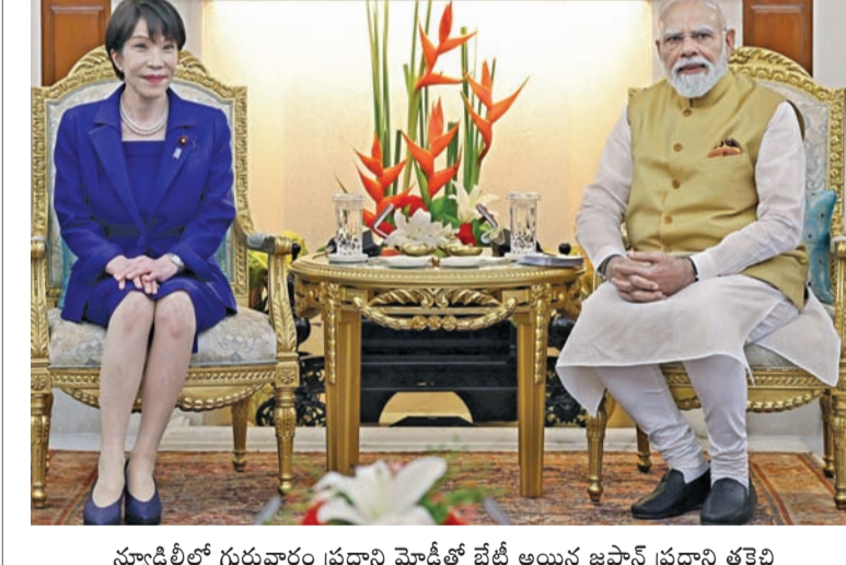
న్యూఢిల్లీలో గురువారం ప్రధాని మోడీతో భేటీ అయిన జపాన్ ప్రధాని తత్సెచి

విద్యార్థులున్నారు. ఇంటర్మీడియట్ మొదటి సంవత్సరానికి సంబంధించి ఈ ఏడాదిలో సిలబస్ కూడా మారబడింది. ఈ నేపథ్యంలో మొదటి సంవత్సరం విద్యార్థులకు కొత్త సిలబస్ ను ప్రింట్ చేసి ఇన్స్టాన్ట్ క్లాసులు బోధించడానికి అవకాశం ఉంటుంది. కాబట్టి కొత్త బుక్స్ కోసం విద్యార్థులు ఎదురు చూస్తూ ఉన్నారు. ఇంగ్లీష్ మీడియం బుక్స్ వచ్చిన నేపథ్యంలో ఇంగ్లీష్ మీడియం బుక్స్ చూసి కొన్ని ప్రాంతాల్లో విద్యార్థులకు పాఠాలు బోధిస్తున్నారు. ఇంగ్లీష్ మీడియం విద్యార్థులకు సరఫరా చేసినట్లుగానే వెంటనే తెలుగు మీడియం విద్యార్థులకు కూడా పుస్తకాలను పంపిణీ చేయాలని విద్యార్థులు, అధ్యాపకులు కోరుతున్నారు. తెలుగు మీడియం బుక్స్ పంపిణీకి సంబంధించి తెలుగు అకాడమీ చైర్మన్ ను సంప్రదించగా.. ఇంటర్ తెలుగు మీడియం బుక్స్ కి సంబంధించి 90 శాతం ప్రింటింగ్ పూర్తి చేసి జిల్లాలకు రవాణా చేశామని తెలిపారు. మిగిలిన 10 శాతం వారం రోజుల్లో పంపిస్తామన్నారు. గత ఏడాది ఇంటర్మీడియట్ లో 90వేల మంది చేరగా.. ఈ ఏడాది ఇప్పటి వరకు 62 వేల మంది చేరారు. మంగళవారంతో ఇంటర్ మొదటి విడత అడ్మిషన్ ప్రక్రియ ముగియగా.. ఈ నెల 1 నుంచి ఈ నెల 31 వరకు రెండో విడత అడ్మిషన్ ప్రక్రియను కొనసాగించడానికి ఇంటర్ బోర్డు కార్యదర్శి ఉత్తర్వులు జారీ చేశారు.