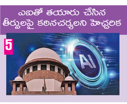
ఎవతో తయారు చేసిన తీర్పులపై కలిసినచర్చలని హెచ్చరిక

న్యాయప్రక్రియలో ఎవి అవసరమా? ఆగ్రహించిన సుప్రీం కోర్టు