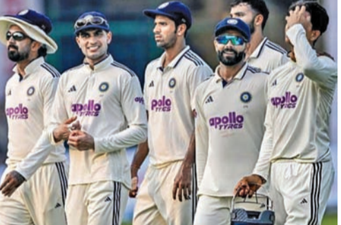
పోతోంది. కాగా 2017 తర్వాత టెస్ట్ల కోసం శ్రీలంక పర్యటనకు టీమిండియా వెళ్లనుందటం తొలిసారి కాదు. అప్పట్లో బిబిసి కోఫీ సారథ్యంలో భారత్ 3-0 తో సిరీస్ ను క్రెజండు చేసుకుంది.

కోలంబో, జూలై 2: ఇంగ్లాండ్ తో టెస్ట్, వన్డే సిరీస్ తర్వాత టీమిండియా... శ్రీలంకలో పర్యటించనుంది. భారత్ తో జరిగే రెండు టెస్ట్ల సిరీస్ షెడ్యూల్ ను శ్రీలంక క్రికెట్ బోర్డు ప్రకటించింది. ఈ సిరీస్ లోని మొదటి టెస్ట్ మ్యాచ్ ఆగస్టు 15 నుండి 19 వరకు గాల్ ఇంటర్నేషనల్ క్రికెట్ స్టేడియంలో జరగనుంది.