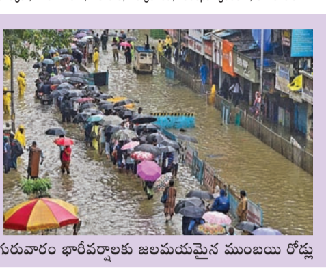
గురువారం భారీవర్షాలకు జలమయమైన ముంబయి రోడ్లు

ముంబయి, జూలై 2: మహారాష్ట్ర రాజధాని ముంబయి భారీ వర్షాలు వణికిస్తున్నాయి. కొద్ది రోజులుగా కరువు స్పష్ట భారీ వర్షాలకు నగర ప్రజలు అతలాకుతలం అవుతున్నారు. గడిచిన 24 గంటల్లో కొన్ని చోట్ల 200 మి.మీ. వర్షపాతం నమోదైంది. అనేక చోట్ల నీళ్లు నిలిచిపోయాయి. ట్రాఫిక్ స్తంభిల్చిపోయింది. ఎడతెరిపి లేకుండా కరువున్న వానలకు ముంబయి నగరంలోని పలుచోట్ల ప్రాంతాలు జలమయ మయ్యాయి. దాదలలోని హిందూకాలనీ వరస రాల్లో రోడ్లపై భారీగా వరద నీరు చేరి >>2