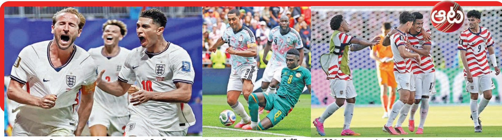
సెనెగల్ విజయం ఆశలపై గిళ్ళు చలిన యూరి బ్రెట్ మన్స్, రెండు మెరుపు గోల్స్ చేసిన హ్యారీ కేన్, గోల్ కొట్టిన అమెరికా ఫార్వర్డ్ బలోగ్గెన్సు అభినందిస్తున్న సహచరులు