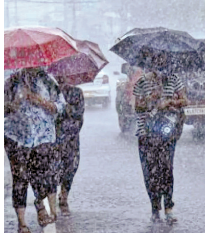
ఉత్తర, ఈశాన్య జిల్లాల్లో భారీ నుండి అతిభారీ వర్షాలు

హైదరాబాద్, జూలై 3, ప్రభాతవార్త: తెలంగాణలో రాబోయే మూడు రోజుల పాటు భారీ వర్షాలు కురుచున్నాయి. ముఖ్యంగా రాష్ట్రంలోని ఉత్తర, ఈశాన్య జిల్లాల్లో భారీ నుండి అతి భారీ వర్షాలు కురిసే అవకాశం ఉందని హైదరాబాద్ వాతావరణ కేంద్రం హెచ్చరించింది. ప్రజలు అప్రమత్తంగా ఉండాలని, ఉరుములు, ఉరుములు, ఉరుములు సమయంలో తగిన జాగ్రత్తలు తీసుకోవాలని సూచించింది. వాతావరణ శాఖ తెలిపిన వివరాల ప్రకారం వాయువ్య బంగాళాఖాతంలో, ఉత్తర ఒడిశా-పశ్చిమ బెంగాల్ తీరానికి ఆనుకుని ఏర్పడిన అల్పపీడనం ప్రస్తుతం మరింత చురుకుగా మారింది. దీనికి అనుబంధంగా ఉన్న ఉపరితల ఆవర్తనం సముద్ర మట్టానికి సుమారు 7.6 కిలోమీటర్ల ఎత్తు వరకు విస్తరించి ఉంది. రాబోయే రెండు రోజుల్లో ఇది మరింత బలవంత అవకాశం ఉందని పేర్కొంది. దీని ప్రభావంలో తెలంగాణలో వర్షాల తీవ్రత పెరిగే అవకాశం ఉందని అంచనా వేశారు. రాష్ట్రంలోని కొన్ని ఉత్తర జిల్లాల్లో ఒకటి రెండు చోట్ల భారీ వర్షాలు కురిసే అవకాశం ఉంది. అలాగే పలు జిల్లాల్లో ఉరుములు, మెరుపులతో పాటు గంటకు 40 నుంచి 50 కిలోమీటర్ల వేగంతో ఉరుములు వీచే అవకాశం ఉంది. రాష్ట్రంలోని చాలా ప్రాంతాల్లో తేలికపాటి నుంచి మోస్తరు వర్షాలు లేదా ఉరుములతో కూడిన జల్లులు కురుస్తాయని వాతావరణ శాఖ తెలిపింది. ఈ నెల 5న కూడా ఇదే పరిస్థితి కొనసాగుతుంది. ఉత్తర జిల్లాల్లో భారీ నుంచి అతి భారీ వర్షాలు, ఉత్తర, ఈశాన్య జిల్లాల్లో భారీ వర్షాలు కురిసే అవకాశం ఉందని తెలిపింది. >>2